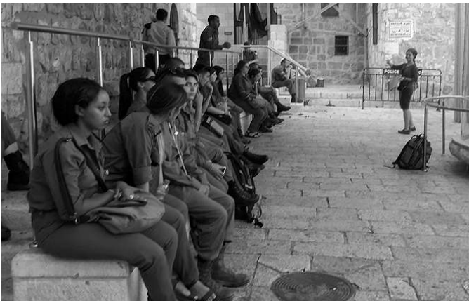
Presencia militar y policial israelí en territorio palestino