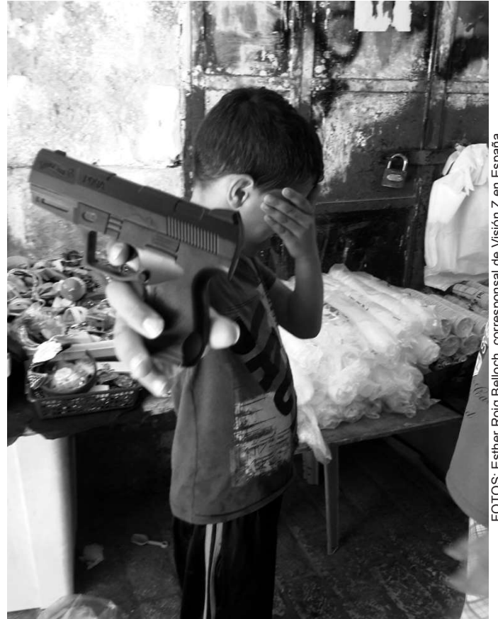
Un niño que esconde su cara con una pistola, crecen en medio de una violencia terrible