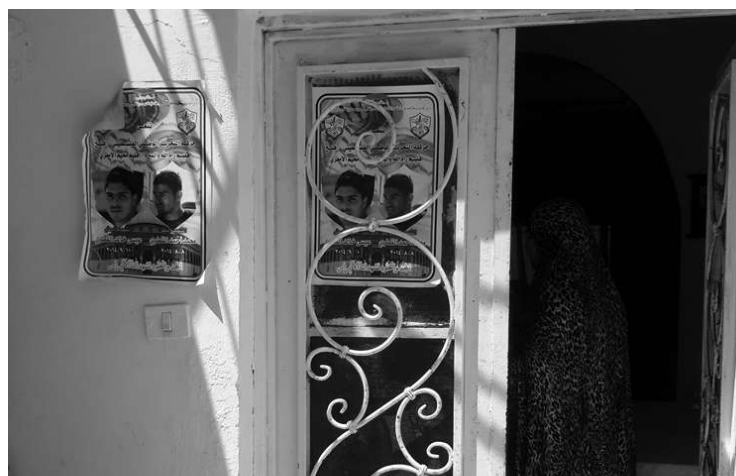
Las casas por dentro son cultos a estos jóvenes que siguen presentes también en las calles de sus barrios.