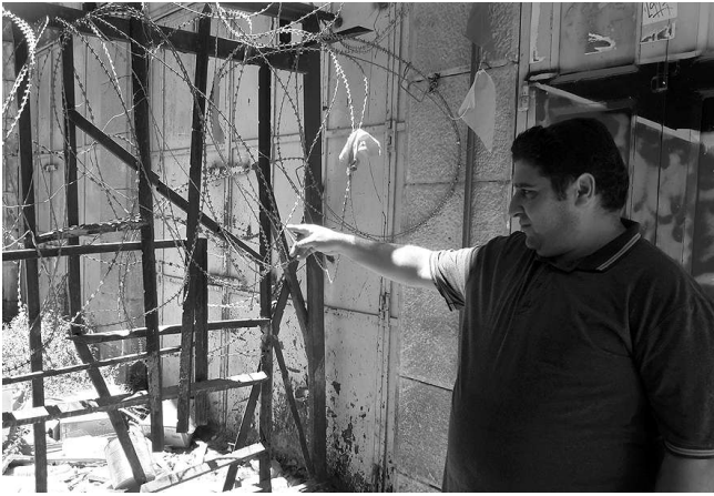
Aquí se ve como viven los palestinos en los barrios ocupados por los judíos.