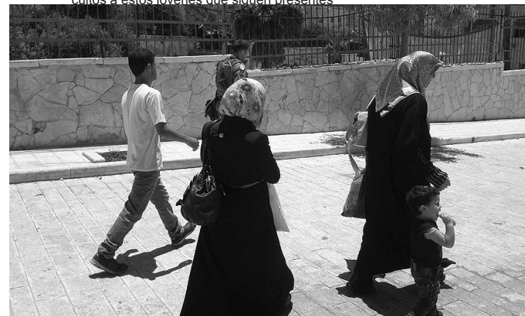
Calles de los barrios de refugiados de Palestina

Los colonos israelíes van ocupando calles, construyendo sus casas, sus sinagogas y van expulsando cruelmente a