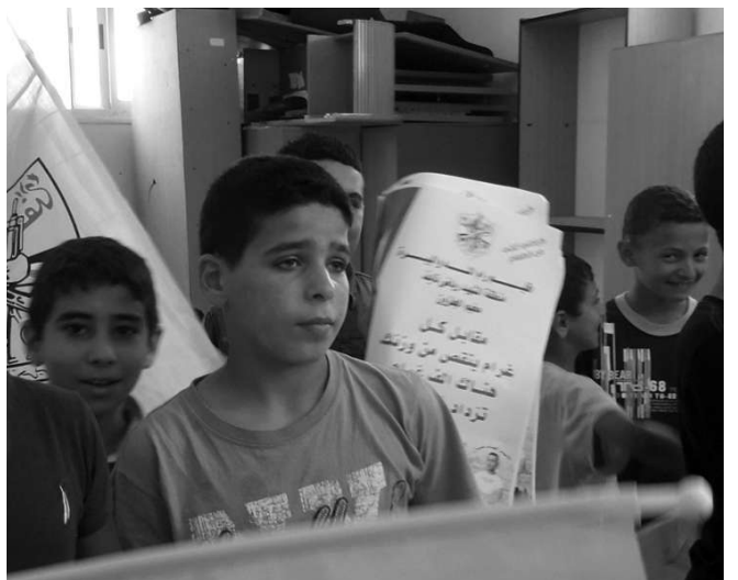
Niños con banderas amarillas, son niños líderes que se preparan para ser mártires por Palestina, todos tienen algún pariente muerto por los judíos.