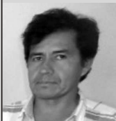
Por: Dr. René Claros Bravo (*) Camiri

hondureños que resisten y se oponen con manos y uñas a este sistema inhumano; son aquellos que supieron que las reglas y el derecho de los burgueses no pueden ser incondicionales ni eternamente absolutos. En estas circunstancias es que han emergido los pensadores de la Resistencia y no como fenómeno casual sino como producto de viejas luchas, de antiguas reivindicaciones populares no satisfechas, seguros de poder participar de algún modo en la organización social y que realizan su labor teórica, creadora de nuevas formas de expresión, dentro y a favor del Frente Nacional de Resistencia Popular. ■