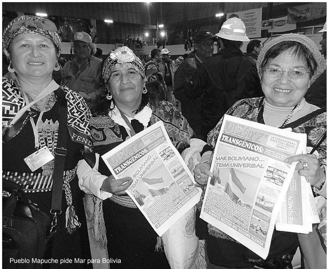
Pueblo Mapuche pide Mar para Bolivia