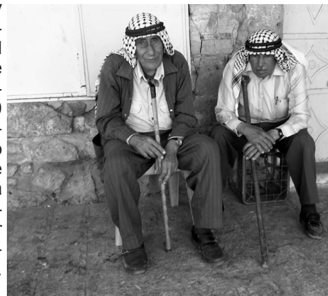
La tristeza de los verdaderos dueños de Palestina

los palestinos. Hay unos 500 colonos judíos viviendo en el casco antiguo de Hebrón y para "protegerlos" hay unos 3000 soldados israelíes repartidos por todo Hebrón. A vista de pájaro, uno se da cuenta que esta ciudad se muere por dentro, agoniza a pesar de la resistencia.