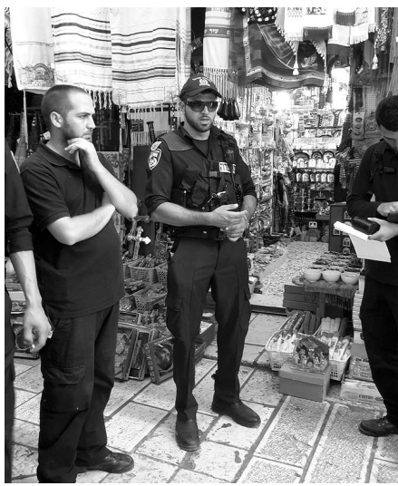
Presencia militar y policial israelí en territorio palestino