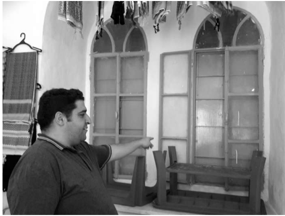
Un palestino señala las ventanas cerradas, es porque si las abre los judíos que han ocupado su barrio le echan piedras.

En Hebrón nos abre las puertas de su casa un palestino que vive con las ventanas cerradas por miedo a las balas de los militares israelíes. Fueron los soldados judíos los que mataron a su mujer embarazada mientras subía a ver el depósito de agua. Ese fue su crimen ver si había o no suficiente agua para la casa. El joven viudo nos permite sacar unas fotos de la vivienda que heredó de sus abuelos, hoy atrapada en medio de una colonia judía, aislado entre alambradas. Como él miles de familias viven esta situación en Palestina. La ocupación es constante, invasiva, destructiva.