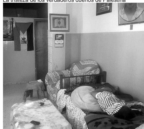
Casas de los barrios de refugiados de Palestina