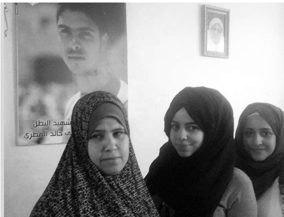
Mujeres junto a la foto del joven palestino muerto son madre, novia y hermana.