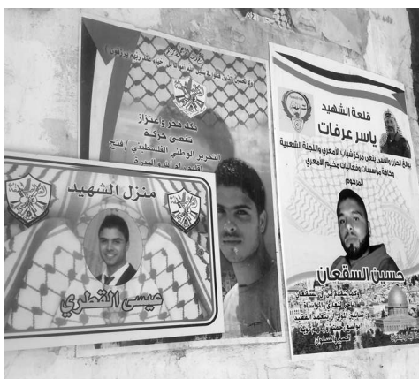
Las casas por dentro son cultos a estos jóvenes.