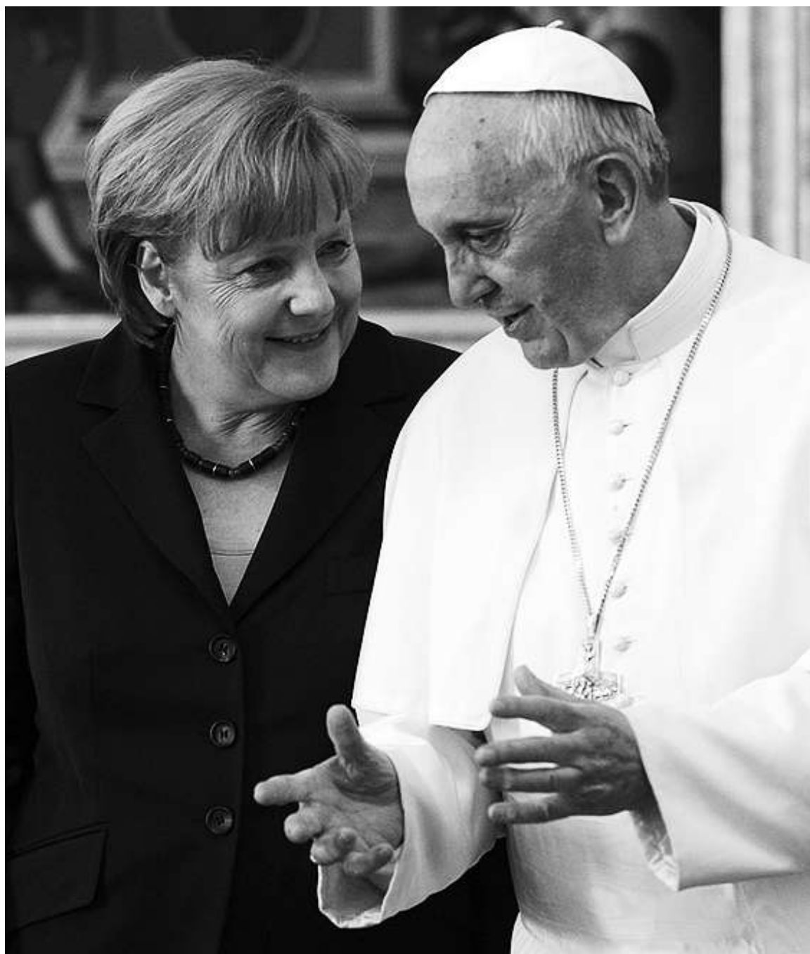
Papa Francisco y la Ministra alemana Angela Merkel

Francisco está consiguiendo la implicación de la gente del pueblo desencantada de la iglesia por papas an-