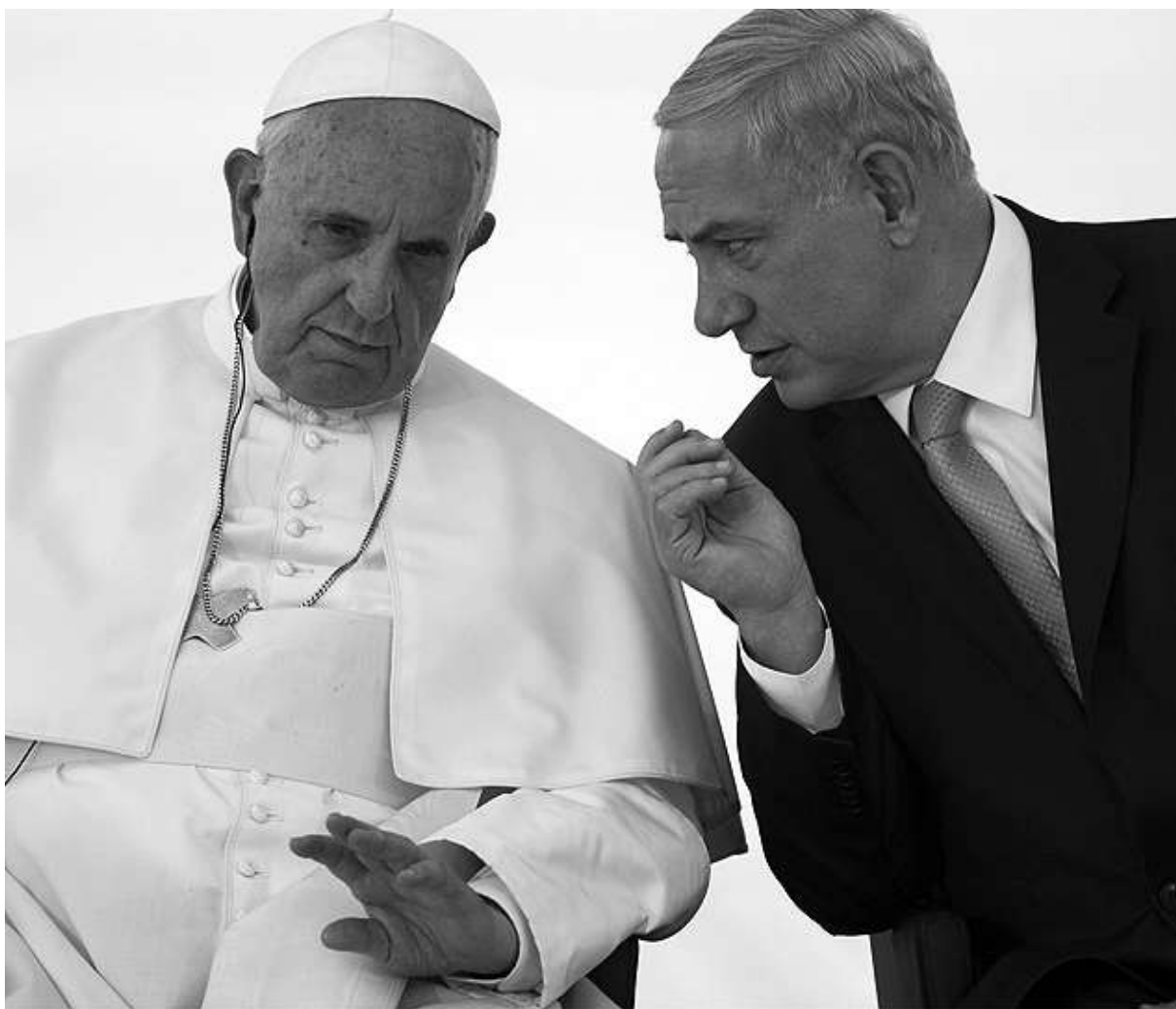
Papa Francisco y el primer ministro israelí, Benjamín Netanyahu

Pero esto no sólo deja ver los verdaderos intereses que mueven a Bergoglio, también exhiben a la orden a la que pertenece. Recordemos que Theodor Herzl fue financiado por la familia Rothschild, una de las más ricas y poderosas del mundo, que ha fungido como el brazo económico de la Compañía de Jesús desde mediados del siglo 18. El apellido Rothschild nos remite directamente a Adam Weishaupt, masón y jesuita, fundador de la orden de los Iluminados de Baviera con el financiamiento de Casa Rothschild, que el 1º de mayo de 1776 comenzaría a sentar las bases para hacerse con el control del mundo. Su primera gran obra fue la Revolución Francesa (1789), le siguieron Polonia (1821), España (1823), Italia y Alemania (1823), Estados Unidos (1861), Rusia (1917), México (1920), China (1927), Cuba (1959) y un largo etcétera.