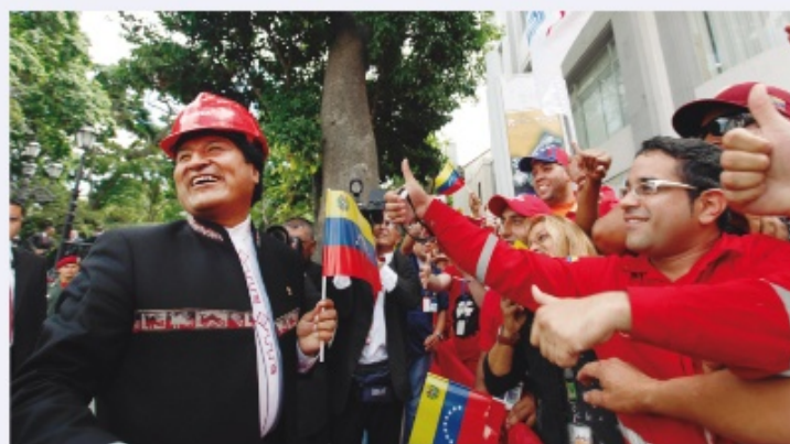
Presidente Evo Morales saluda a organizaciones sociales en Caracas, Venezuela.