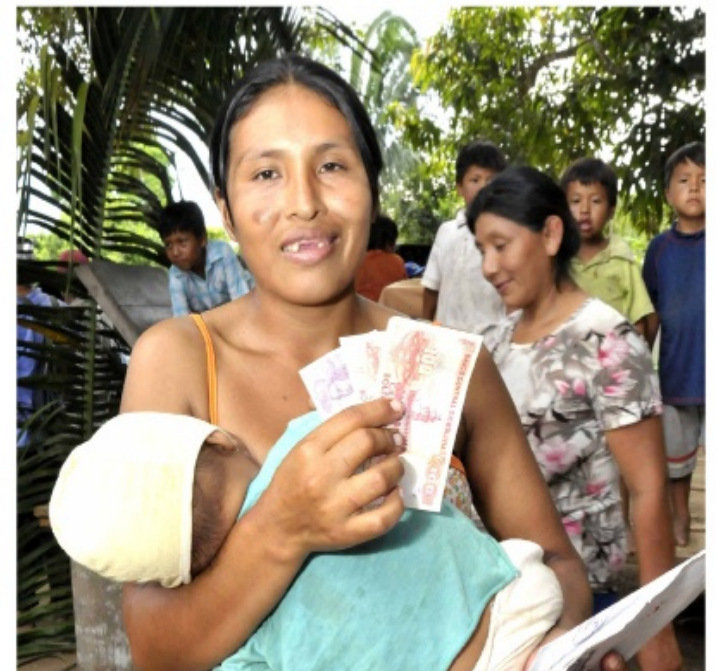
Con los recursos de la nacionalización de hidrocarburos, de telecomunicaciones, electricidad y otros rubros, el Estado ha creado bonos sociales para todos los sectores de la población.