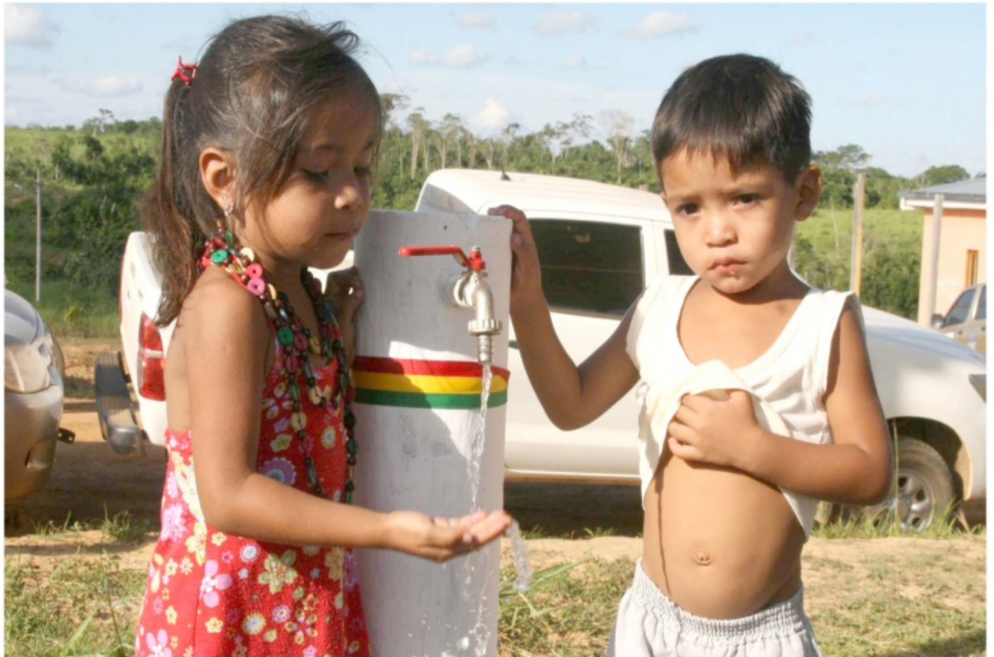
Bolivia, "un caso excepcional" en América Latina, la reducción de la pobreza se refleja también en la dotación de servicios básicos a sectores que antes fueron marginados.

Por primera vez, el Parlamento boliviano está compuesto por el 49% de congresistas mujeres. Para Oxfam, Bolivia es el país "que más redujo la brecha de desigualdad a nivel mundial gracias a la transformación de reglas financieras".