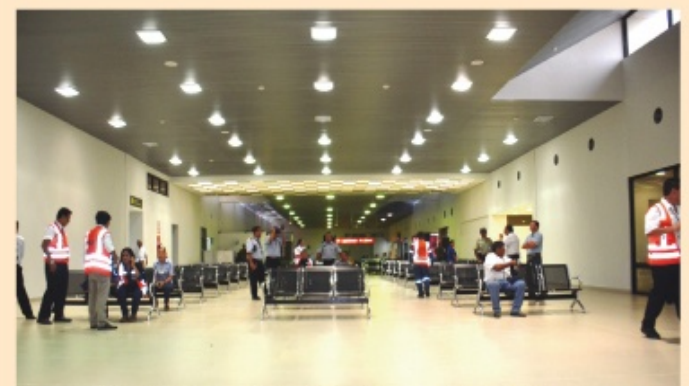
La ampliación de la terminal aérea de Viru Viru se realizó en 4.265 metros con la inversión de recursos propios de Servicios de Aeropuertos de Bolivia, SABSA.

Cuenta, además, con 20 equipos de asistencia en tierra, entre ellos: 10 carros portaequipaje, tres cintas transportadoras, un arrancador para neumáticos, dos tractores de arrastre, uno de remolque, una escalera motorizada y un manual. Nueve barras de remolque para atender diferentes tipos de aviones y un carro bombero con capacidad para 12.500 litros de agua, y 1.750 litros de concentrado de espuma.