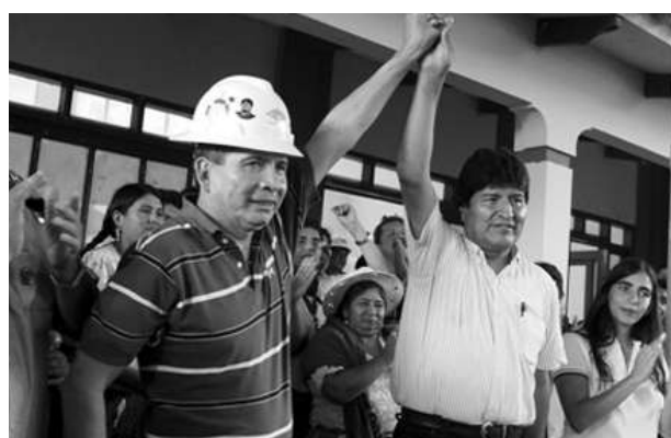
Rolando Borda, candidato a Gobernador "MAS"