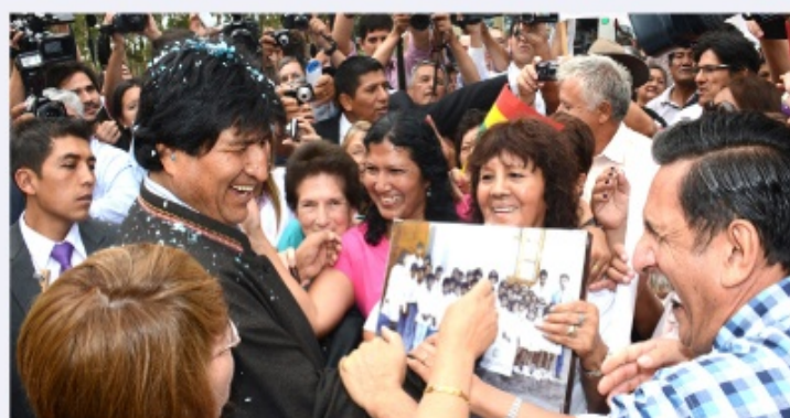
El presidente boliviano, conversa con la primera profesora de su niñez y sus ex compañeros de escuela, en la comuna de Campo Grande, donde visitó la unidad educativa, Salta Argentina.