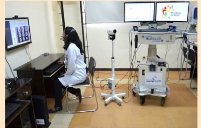
Para garantizar el acceso a la salud en todo el territorio boliviano, especialmente en áreas rurales, el estado puso en marcha el programa de salud a distancia.