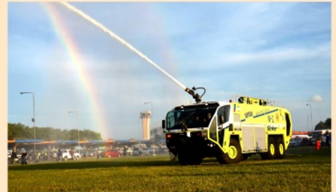
Carro bombero con una capacidad de 12.500 litros de agua y un almacenaje de 1.700 litros de concentrado de espuma