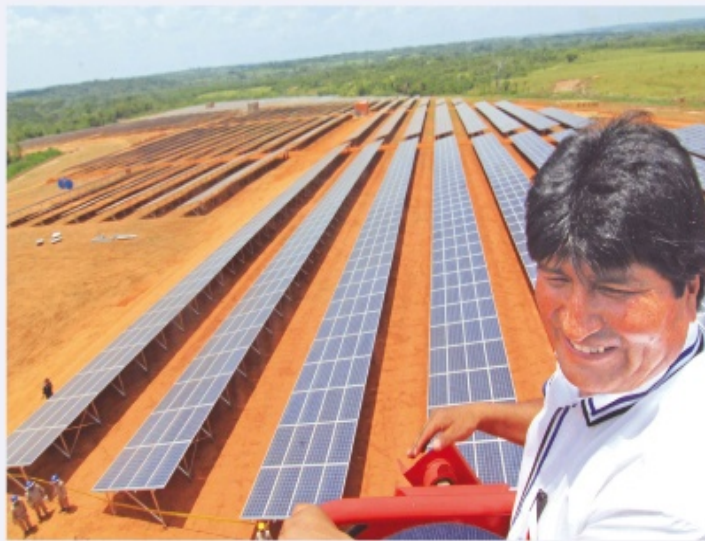
La planta solar fotovoltaica Cobija corresponde al primer proyecto piloto de energía solar que se instala en Bolivia, generará 7.500 megawatios por año.