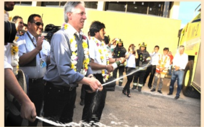
El Presidente Morales junto al Vicepresidente Alvaro García entregaron la ampliación del aeropuerto de Viru Viru en Santa Cruz