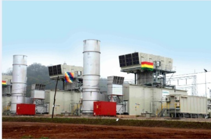
Primera fase de la Termoeléctrica del Sur, ubicada en la localidad de Yaguacua en el municipio de Yacuiba.

El Gobierno anunció la inversión de por más de $us 2.000 millones para la ejecución de estos proyectos y otros emprendimientos con el objetivo de incorporar al menos 2.204 MW al Sistema Interconectado Nacional.