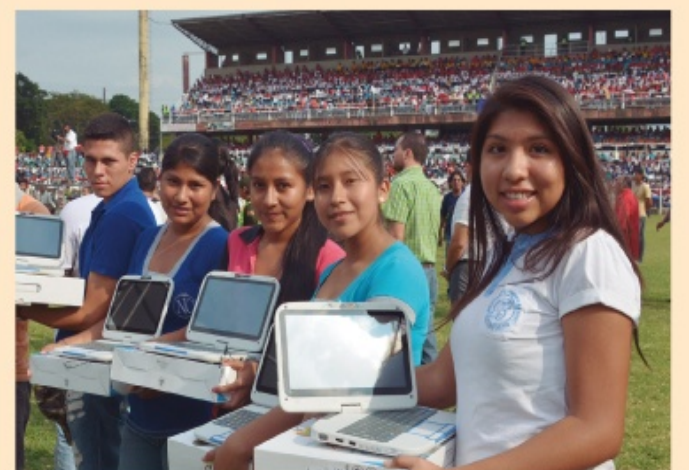
El gobierno entregó 14.050 computadoras portátiles a igual número de estudiantes de sexto de secundaria de la ciudad de Santa Cruz

Otro salto importante a la modernidad es el proyecto del teleférico en la ciudad de La Paz con tres líneas (Roja, Amarilla y Verde), 427 cabinas, 11 estaciones, 10,4 kilómetros de recorrido y una inversión de más de Bs 235 millones. Este año se sumarán otras seis líneas más posicionando a Bolivia como el país con el teleférico más moderno de transporte masivo en el mundo.