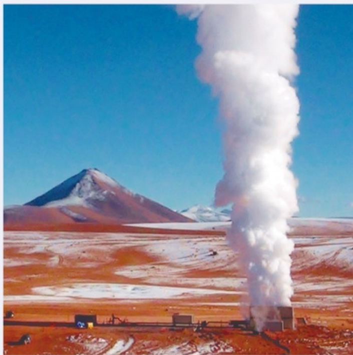
La construcción de la Planta Geotérmica Laguna Colorada, Fase I de la Primera Etapa, tiene como objetivo incrementar y estabilizar la provisión de energía eléctrica a partir de la construcción de una planta de energía geotérmica de 50 megavatios, en el municipio de San Pablo de Lípez, provincia Sud Lípez del departamento de Potosí.