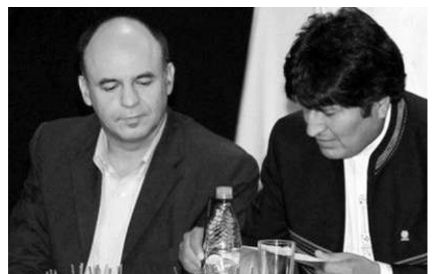
Reymi Ferreira, candidato a Alcalde "MAS"