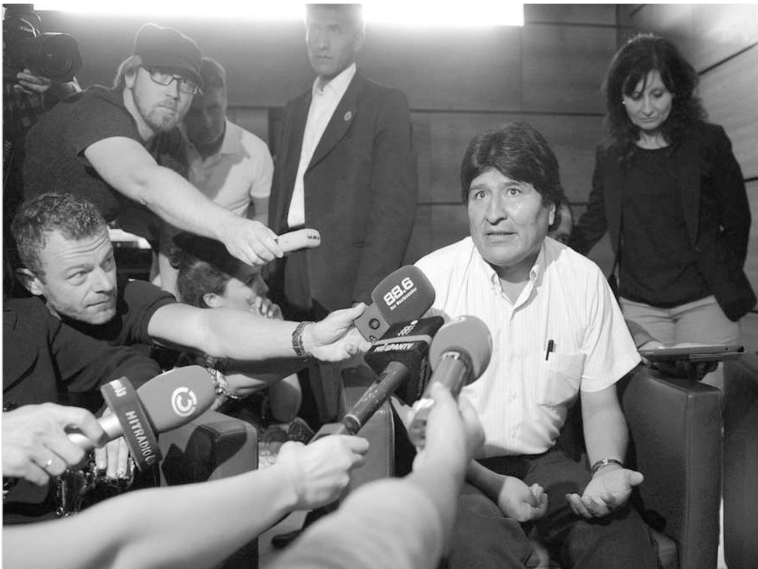
Presidente Morales, requerido por la prensa internacional

Pero además Bolivia es hoy un referente de defensa del derecho internacional y está situada en buen lugar como para promover un movimiento contra las guerras y por una ONU de los Pueblos. Ojalá tomara estas iniciativas. ■