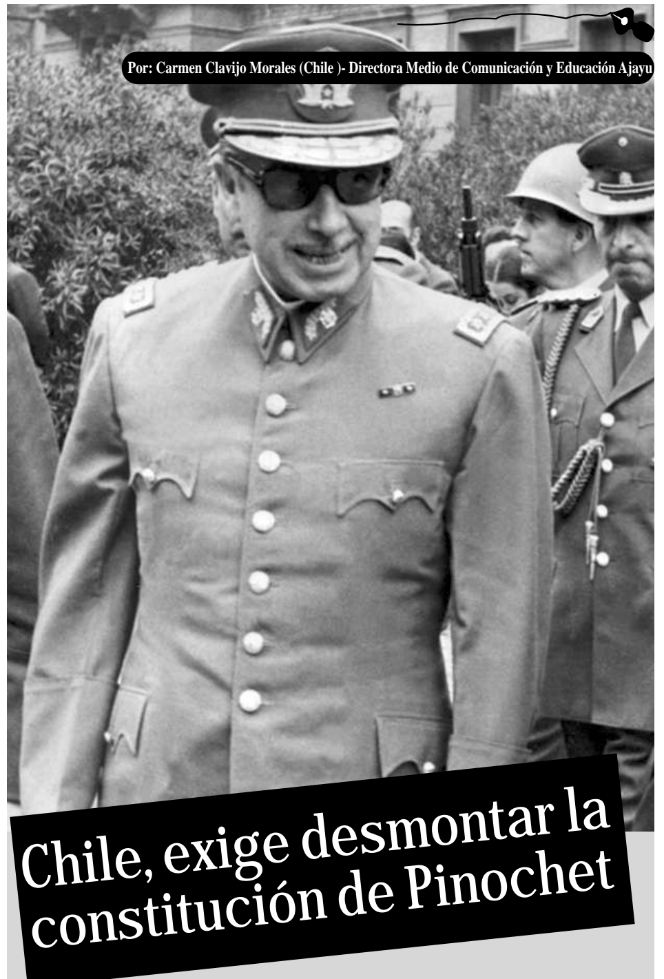
Por: Carmen Clavijo Morales (Chile) - Directora Medio de Comunicación y Educación Ajayu