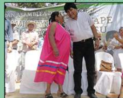
Visión - Z Bolivia