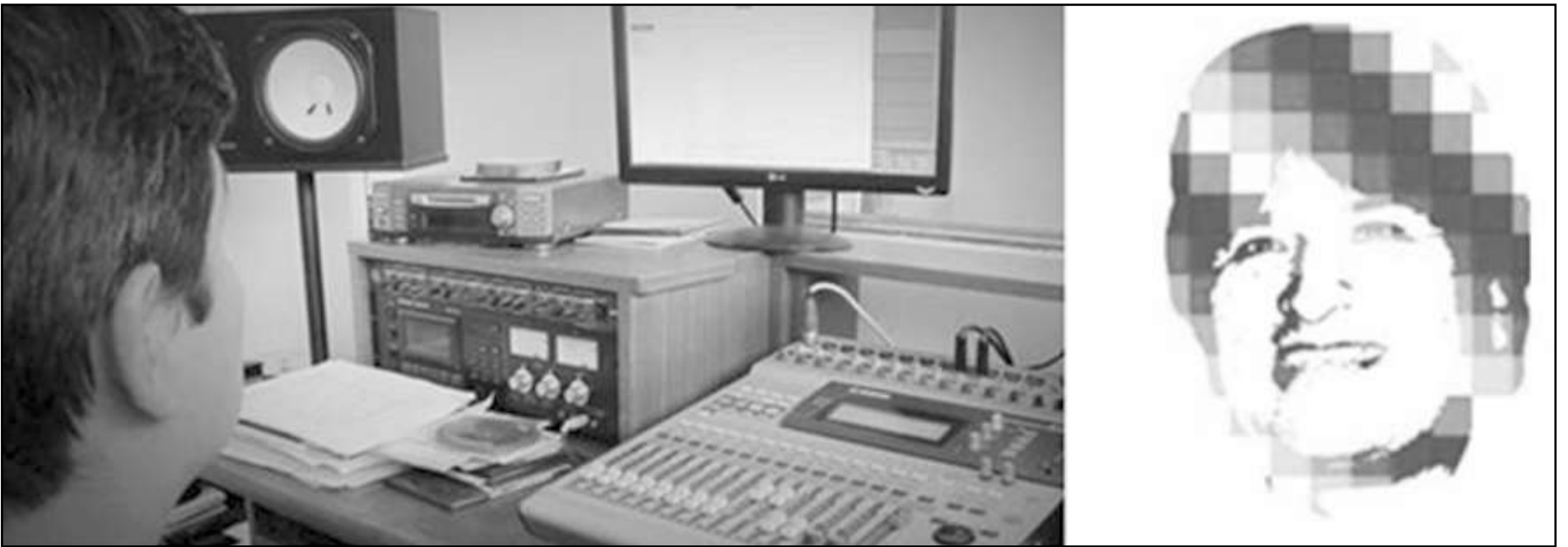
Producción de Radionovela: "KURAQ KAMACHIQ KAWSAYNIN", con el auspicio del Ministerio de Comunicación